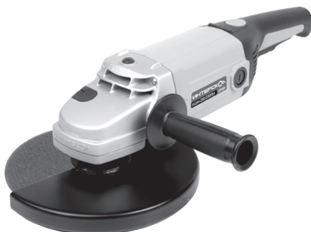
УШМ-180/1800М, УШМ-230/2100М, УШМ-230/2300М